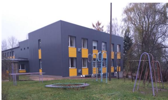
Esošais laukums pie Ludzas novada Pildas pamatskolas. 2019. gads.