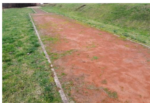
Pirmsprojekta fotofiksācija, 2019.gads.