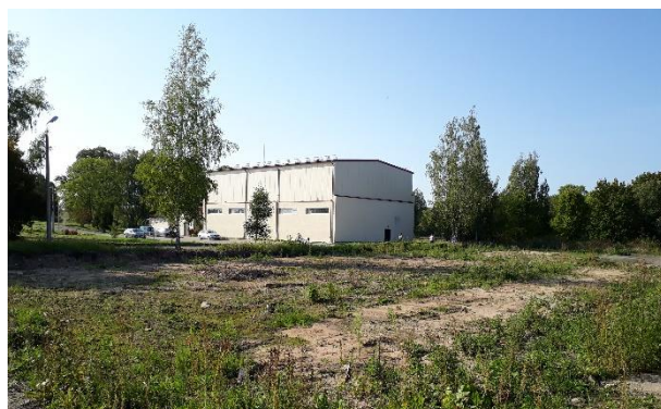
Pirmsprojekta fotofiksācija, 2019. gads.