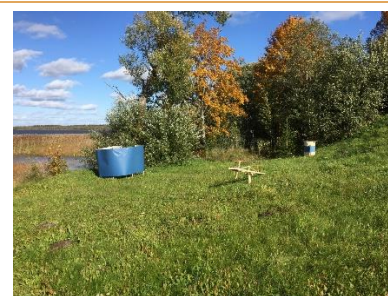
Atpūtas vieta "Pludmale" (labā puse)

Pirmsprojekta fotofiksācija, 2019.gada septembris.