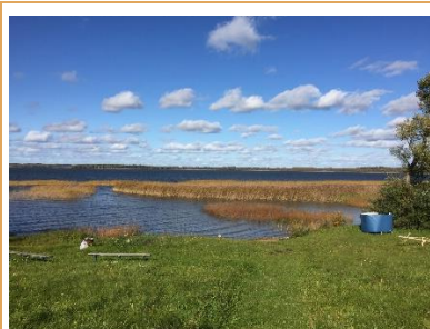
Atpūtas vietas "Pludmale" (kopskats).