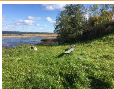
Atpūtas vieta "Pludmale" (kreisā puse)