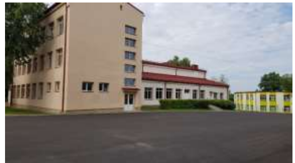
Foto pēc projekta realizācijas.