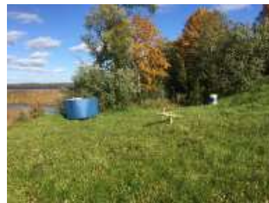
Atpūtas vieta “Pludmale” (labā puse)

Pirmsprojekta fotofiksācija, 2019.gada septembris.