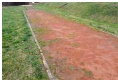
Pirmsprojekta fotofiksācija, 2019.gads.