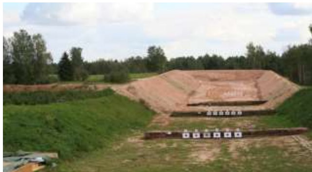
Bildei informatīvs raksturs