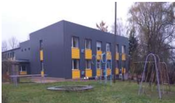
Esošais laukums pie Ludzas novada Pildas pamatskolas. 2019. gads.