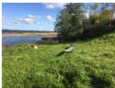
Atpūtas vieta “Pludmale” (kreisā puse)