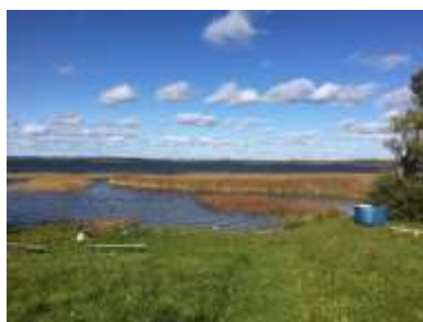
Atpūtas vietas “Pludmale” (kopskats).