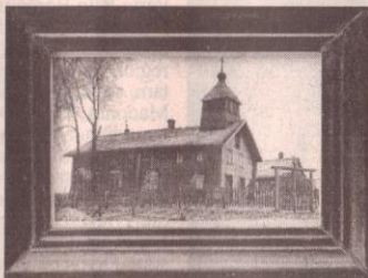
Tā Nikolaja baznīca izskatījās pirms simt gadiem.