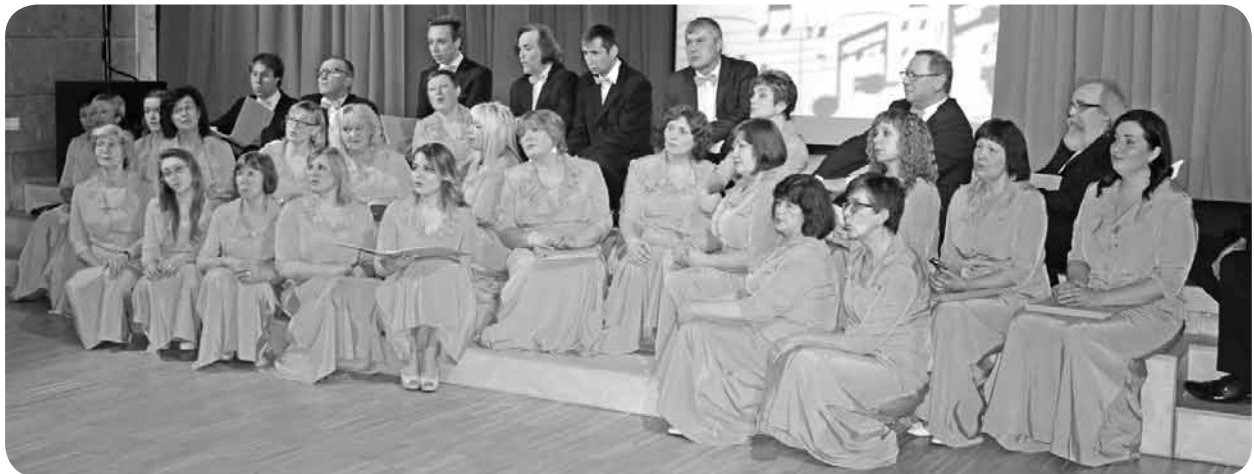
Ļaudonas jauktais koris "Lai top!".