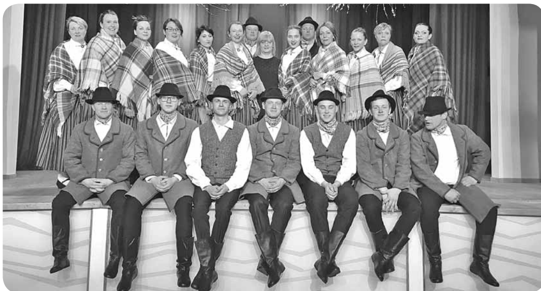
VPDK "Grieze" pēc koncerta Mazsalacā.

Ģatavojoties tautisko deju kolektīvu koncertam/skatei, kas norisinājās 6. aprīlī Lauterē, Ļaudonas vidējās paaudzes deju kolektīva "Grieze" dejojāji piedalījušies vairākos ārpus pagasta koncertos. 23. martā viesojās un dejoja Mētrienas vidējās paaudzes deju kolektīva "Meteni" kolektīva 10 gadu jubilejas koncertā, 30. martā pirmo reizi uzstājās Mazsalacā vidējās paaudzes deju kolektīvu sadancī "Mēs tikāmieš martā", savukārt 5. aprīlī devās uz sadanci Degumniekos "Izdejojot sirdī pavasari".