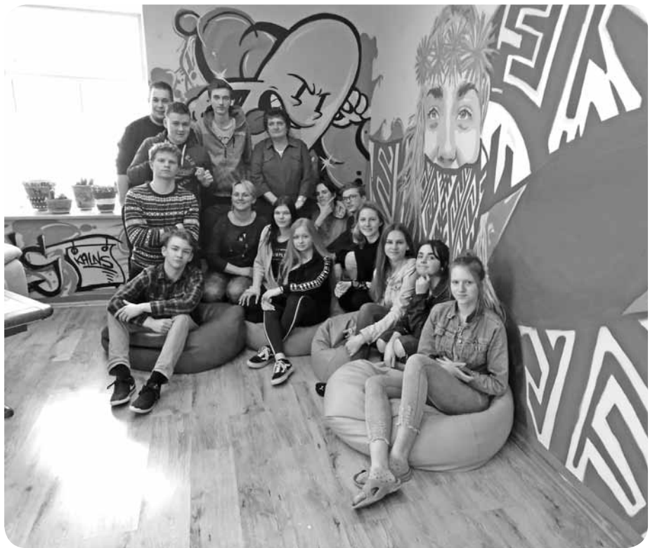
Ciemojoties un gūstot pieredzi Bērzaunes jauniešu centrā.

Šogad atjaunojām tradīciju - sadraudzības pasākumos apmeklēt novada jauniešu centrus, lai smeltos jaunas idejas savam darbam. Janvārī bijām Kalsnavas jauniešu centriņā UP's, bet februārī - Bērzaunes bērnu un jauniešu apvienībā RĪTS. Abos centriņos iemācījāmies jaunas spēles un rotaļas un labi pavadījām laiku. Bērzaunē radošajās darbnīcās lējam svecas, un katrs sava darba rezul-