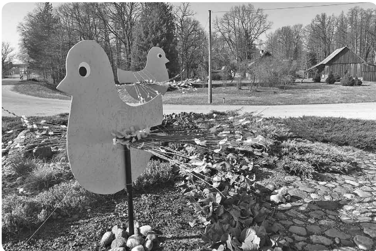
Uz ceļu krustojuma satupuši glīti cāļi – pavasara saulgriežu vēstneši. Autors - pagasta dārzniece Inga Zālīte.