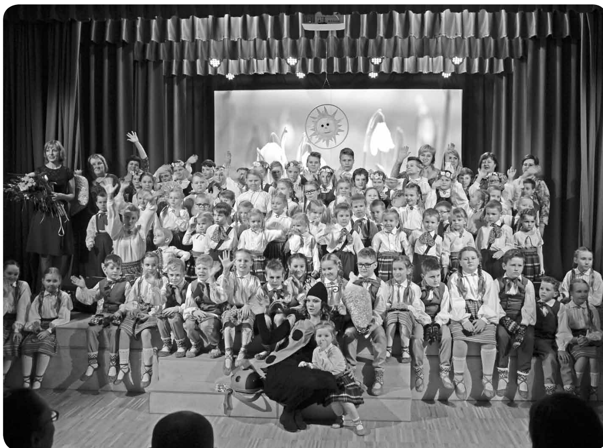
Deju koncerta dalinieku kopbilde – visi priecīgi un gandarīti!

15. martā Ļaudonas kultūras nams rībēja un skanēja, jo šeit pulcējās PII "Brīnumdārzs" un A. Eglīša Ļaudonas vidusskolas dejotāji, lai ar lustīgām dejām sasauktu pavasara saulīti.