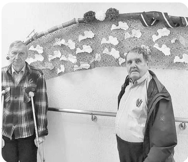
Pansionāta iemītnieki pie izgatavotā dekora.