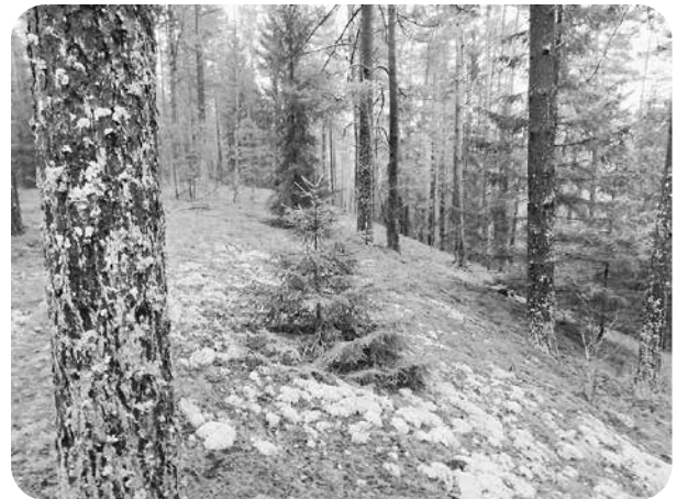
Vēl neaizauguši laukumi, kuros sastopamas raksturīgās sugas.

Darbs 2021. gada nogalē sāksies ar pameža un paaugas ciršanu 12 ha platībā. Tad sekos otrā stāva egļu, bērzu un citu atsevišķu koku, kas rada spēcīgu apēnojumu,