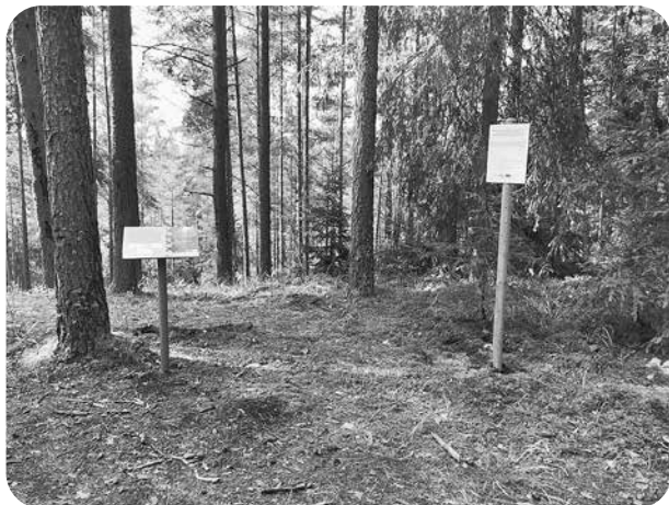
Darbi notiks Velna gravas nogāzē.

novākšana. Saglabāsim kadiķus, sausos kokus un kritālas, kā arī bioloģiski vecos kokus, kas ir mājvieta citām retām sugām. Saglabājamās dabas vērtības darbu veikšanas vietā ir marķētas sarkanā un zaļā krāsā, piemēram, tiek marķēti