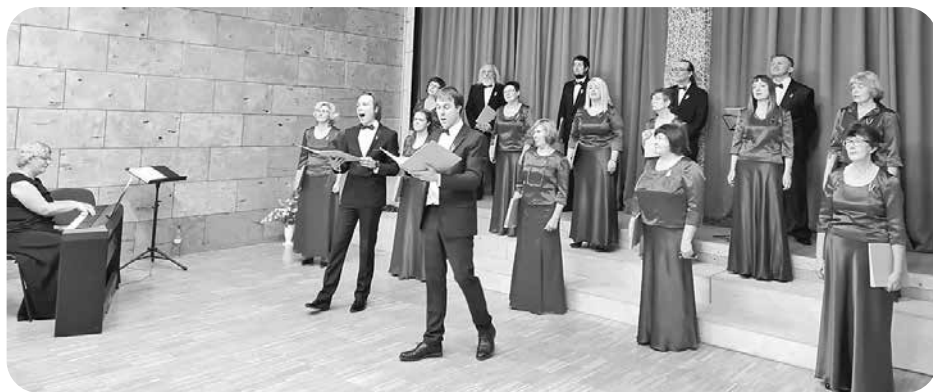
Jauktais koris „Lai top!” uzstāšanās laikā.

2020. gada novembrī Ļaudonas pagasta pārvalde sumināja daudzus Ļaudonas pagasta iedzīvotājus par īpašu attieksmi pret Ļaudonu – tāpat arī pret Latviju.