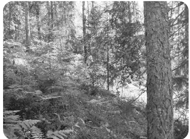
Nogāzes pamazām aizaugušas ar eglēm.