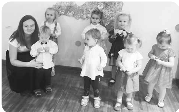
„Zaķu” grupa Latvijas svētkos.