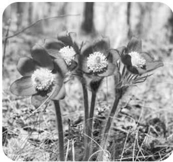
Meža silpurene – raksturīga osu mežu augu suga.