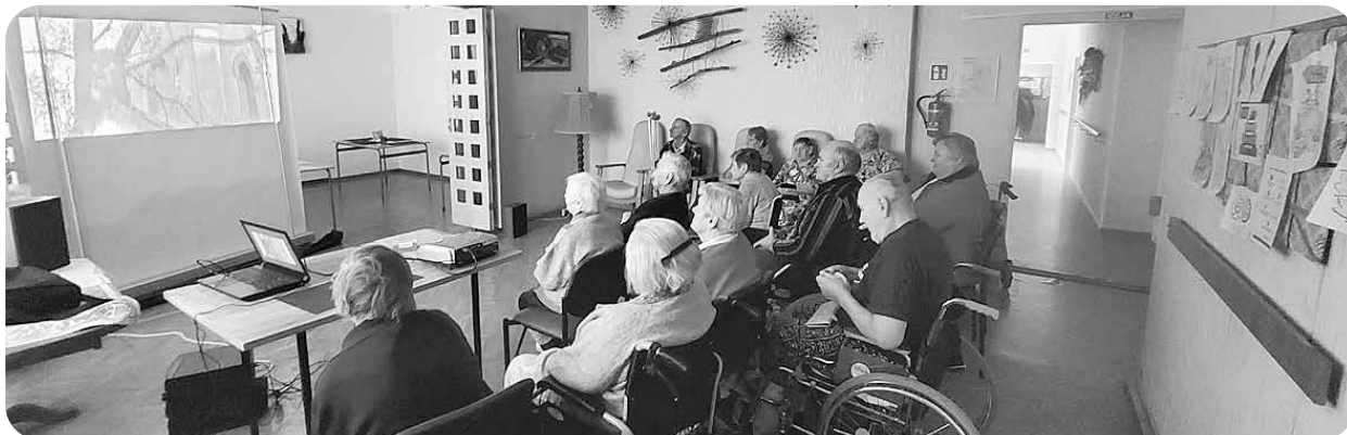
Pie lielā ekrāna, skatoties filmu.

Arī pansionātā ar senioriem atzīmējām šos svētkus. Lai gan gaili nekāvēm, bet par Mārtiņdienu un Lāčplēša dienu lasījām, runājām un diskutējām. Tā kā plašāki pasākumi vēl nav atļauti stingro ierobežojumu dēļ, tad svētku sajūtu veidojām sev paši. Tuvojoties Latvijas Valsts dzimšanas dienai, visi staigājām ar patriotiskajām piespraudēm pie apģērba.