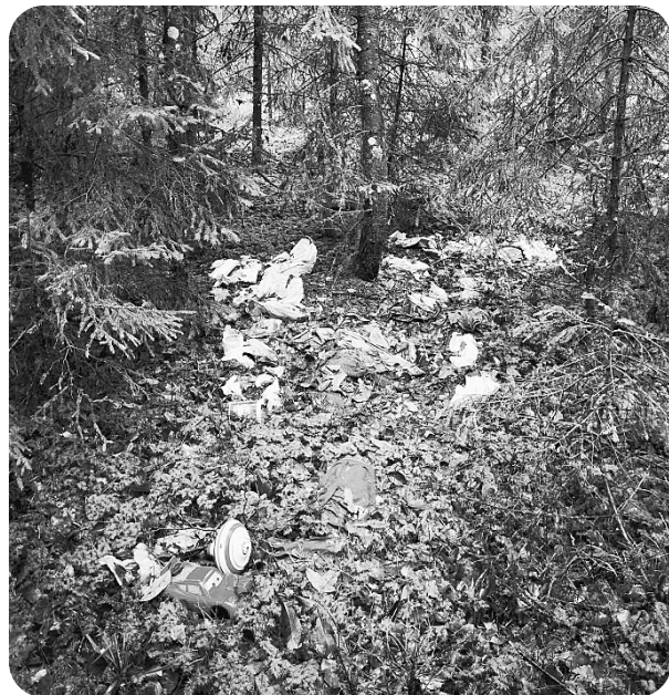
Šis divas atkritumu izgāztuves ir nesēn parādījušās mūsu skaistajā Driksnas silā.