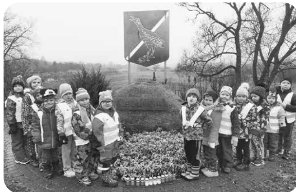
„Kaķu” grupa apmeklēja Aiviekstes tiltu.

Laura Pelse, PII „Brīnumdārzs” skolotāja