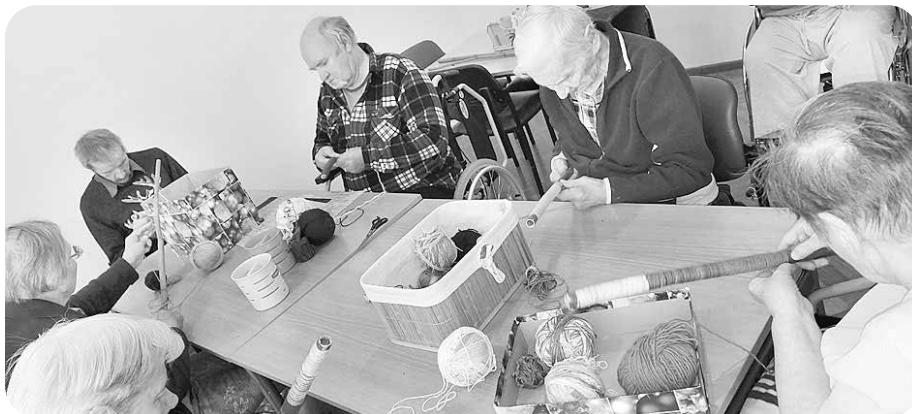
Aktīva rokdarbu darināšana.