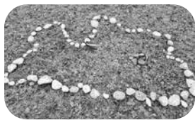
Izveidotā Latvijas kontūra par godu valsts svētkiem.

Pavisam nemantot, ir pienācis novembris, un, par spīti šim tumšajam laikam, „Brīnumdārzs” turpina aktīvi un radoši darboties, arī ierobežojumu ieskausti.