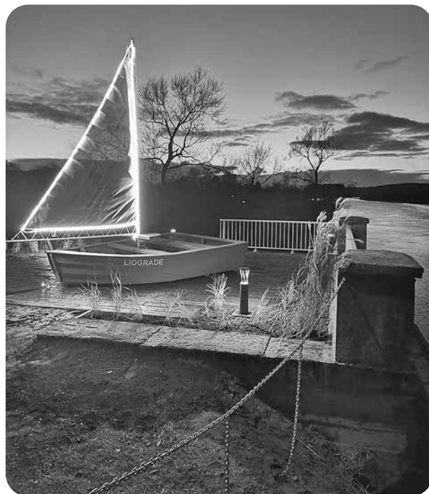
Jaunatklātais vides objekts.

Sargāsim, mīlēsim un kopsim vidi, kur dzīvojam!