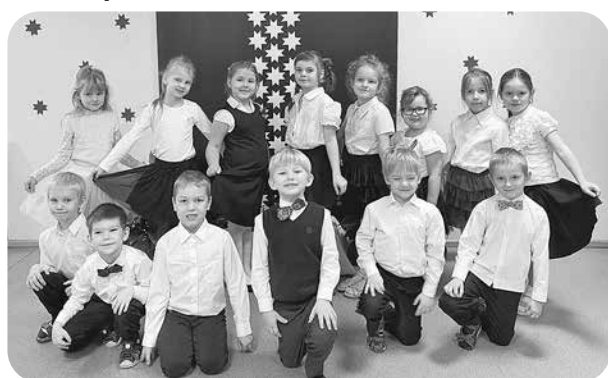
„Kaķu” grupa valsts svētku noskaņā.