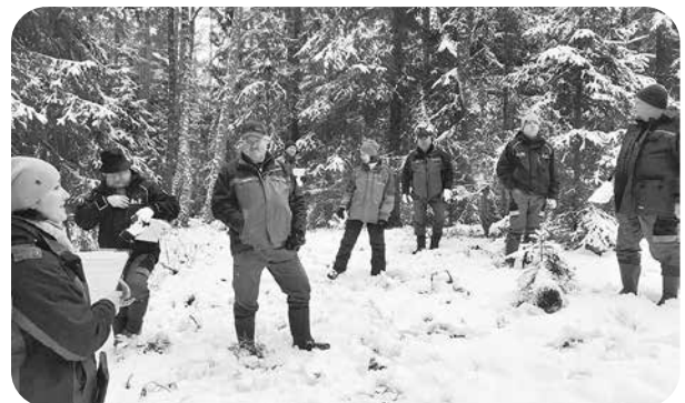
Sanāksmes dabā un darbu plānošana.