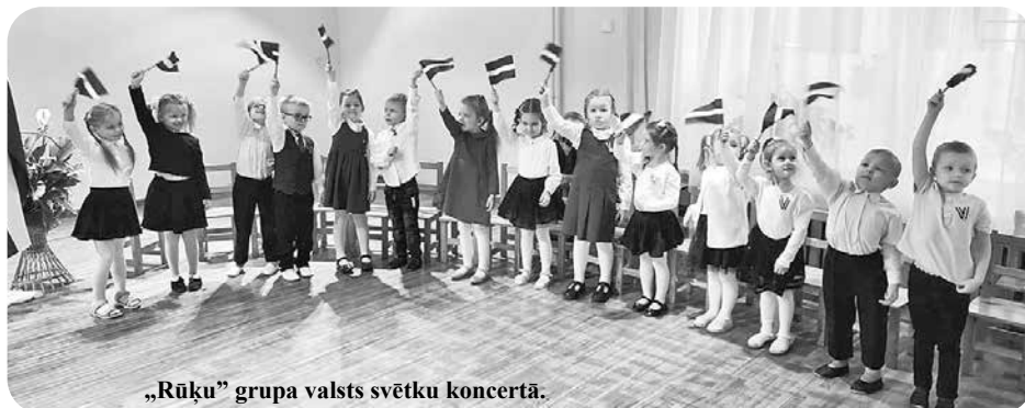
„Rūķu” grupa valsts svētku koncertā.

11. novembrī tiek atzīmēta Lāčplēša diena, kad godinām latviešu karavīrus, kuri pirms gadu desmitiem