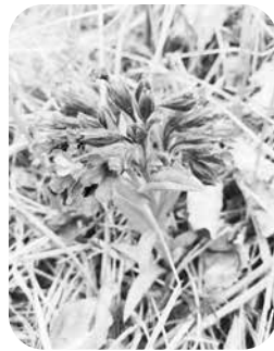
Šaurlapu lakacis – suga, kuru varētu gaidīt atpakaļ.

AS "Latvijas valsts meži" eksperti sagatavojuši informāciju, par to, ka uzņēmums uzsācis biotopa "Driksnas sils" kopšanas darbus, lai saglabātu retos osu mežus un veidotu skraju, saules izgaismotu priežu mežu, kurā retajām augu sugām būs iespēja iesēties izveidotajos atklātajos, labāk apgaismotajos laukumos.