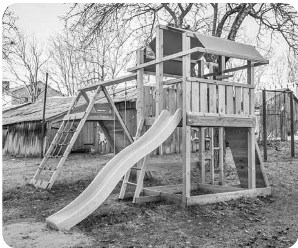
Uzstādītā bērnu rotaļu laukuma iekārta.