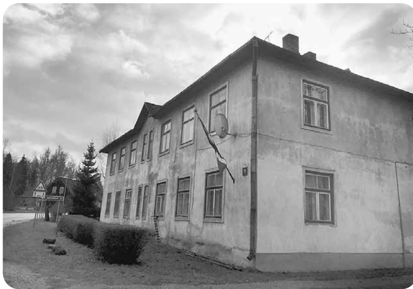
Ēka Brīvības ielā 9, plašāk zināma kā „Skolotāju māja”.

2021. gada 17. augustā ir saņemts dzīvojamās mājas Brīvības ielā 9, Ļaudonas pagastā, Madonas novadā īrnieku iesniegums ar lūgumu Madonas novada domei sniegt palīdzību pirms trīs mēnešiem notikušās vētras radīto postījumu likvidēšanai, lai pārtrauktu iedzīvotāju necilvēcīgos